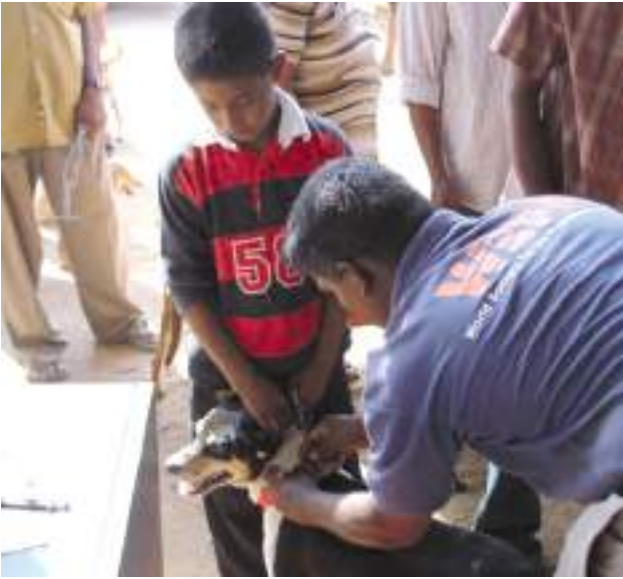
საიდენტიფიკაციო ყელსაბმის შებმა (შრი- ლანკა)