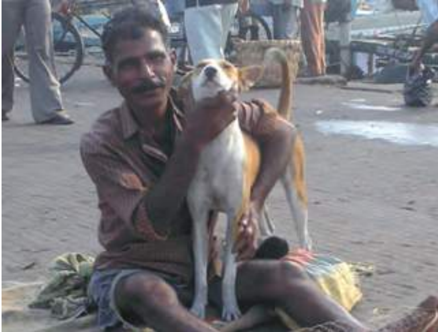
მეთევზე და მანანალა ძაღლი ინდოეთში

ძაღვების პოპულაციის მართვის პროგრამის დაწყებამდე აუცილებელია პოპულაციის დინამიკის შესწავლა და ობიექტურად შეფასება