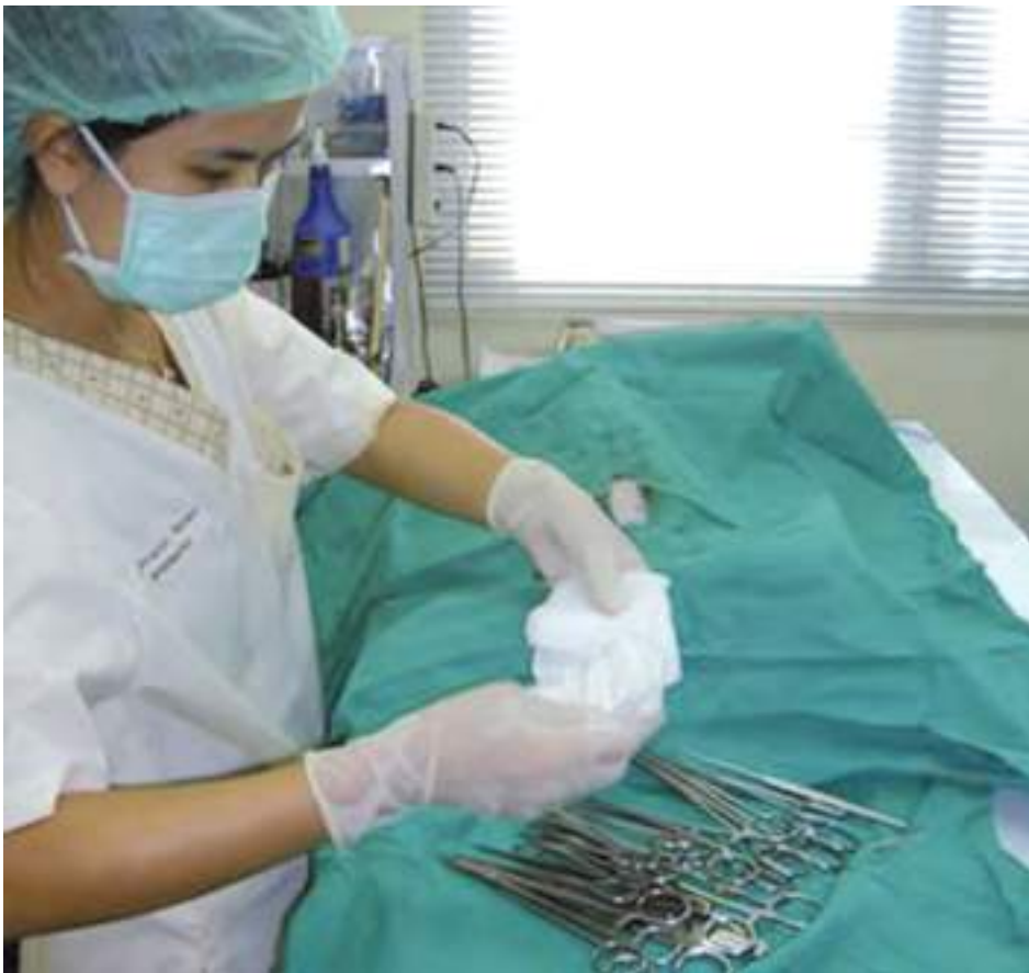
ქირურგიული ოპერაცია (ტაილანდი)

ევთანაზია მხოლოდ პოპულაციის პრობლემების სიმპტომებს ებრძვის და არა მის გამომწვევ მიზეზებს. აპრიორი ის ვერ უზრუნველყოფს პოპულაციის მართვას და ძირითად ინსტრუმენტად მისი გამოყენება მიუღებელია. ევთანაზია უნდა ჩატარდეს ჰუმანური მეთოდებით, რაც იმის საწინდარია, რომ ცხოველი მოკვდება წამების გარეშე.