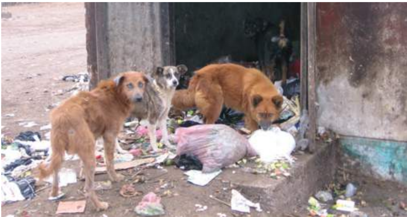
მანანალა ძაღლები ნაგვის ბუნკრეთან

ჩატარდეს დაკვირვება მანანალა ძაღლებზე და პარალელურად გამოკითხვა ადგილობრივ მეპატრონეებში მანანალა ძაღლების სავარაუდო რაოდენობის შესახებ (გამოკითხვის ჩატარების პერიოდში).