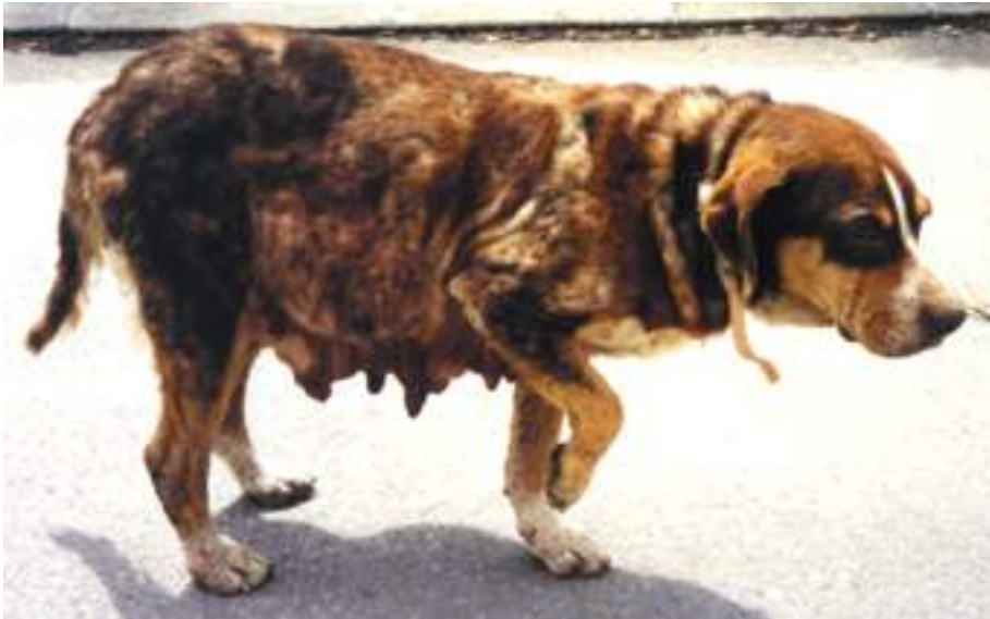
ძაღლს ჰყავს პატრონი, მაგრამ სეირნობს უმეთვალყურეოდ (პორტ უგალია)

კეთილდღეობის პრობლემები შეიძლება წამოიჭრას როგორც შეზღუდულ სივრცეში მოძრავე (ჩაკეტილ), ასევე მანანნალა ძაღლებთან დაკავშირებით. თავისი ამოცანებიდან გამომდინარე წინამდებარე დოკუმენტი ძაღლების პოპულაციის მართვის მიზანს განმარტავს, როგორც “მანანნალა ძაღლების პოპულაციისა და მასთან დაკავშირებული რისკების მართვას, მათ შორის, პოპულაციის შემცირებას, როდესაც ეს აუცილებელია”.