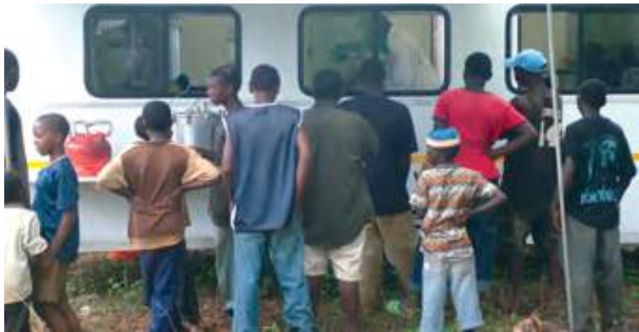
ადგილობრივები თვალს ადევნებენ ცხოველის სტერილიზაციას მობილურ კლინიკაში (ზანზიბარი).