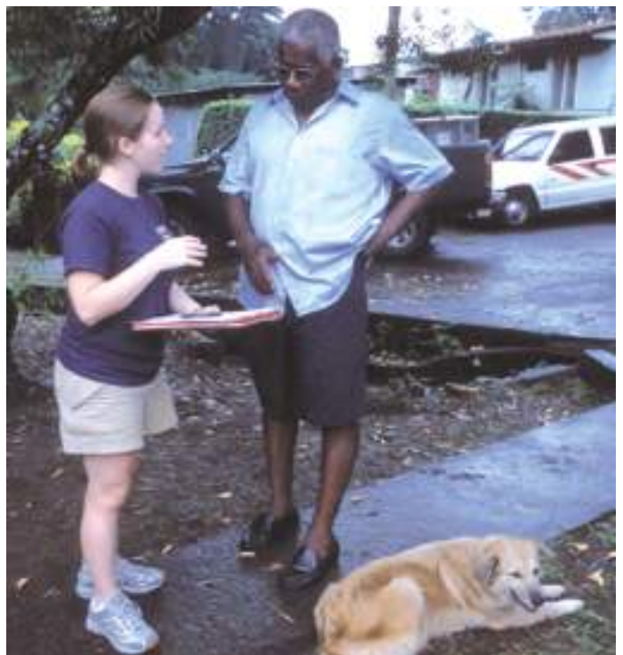
ცხოველთა მკურნალობის გამოკითხვა (დომინიკის რესპუბლიკა)